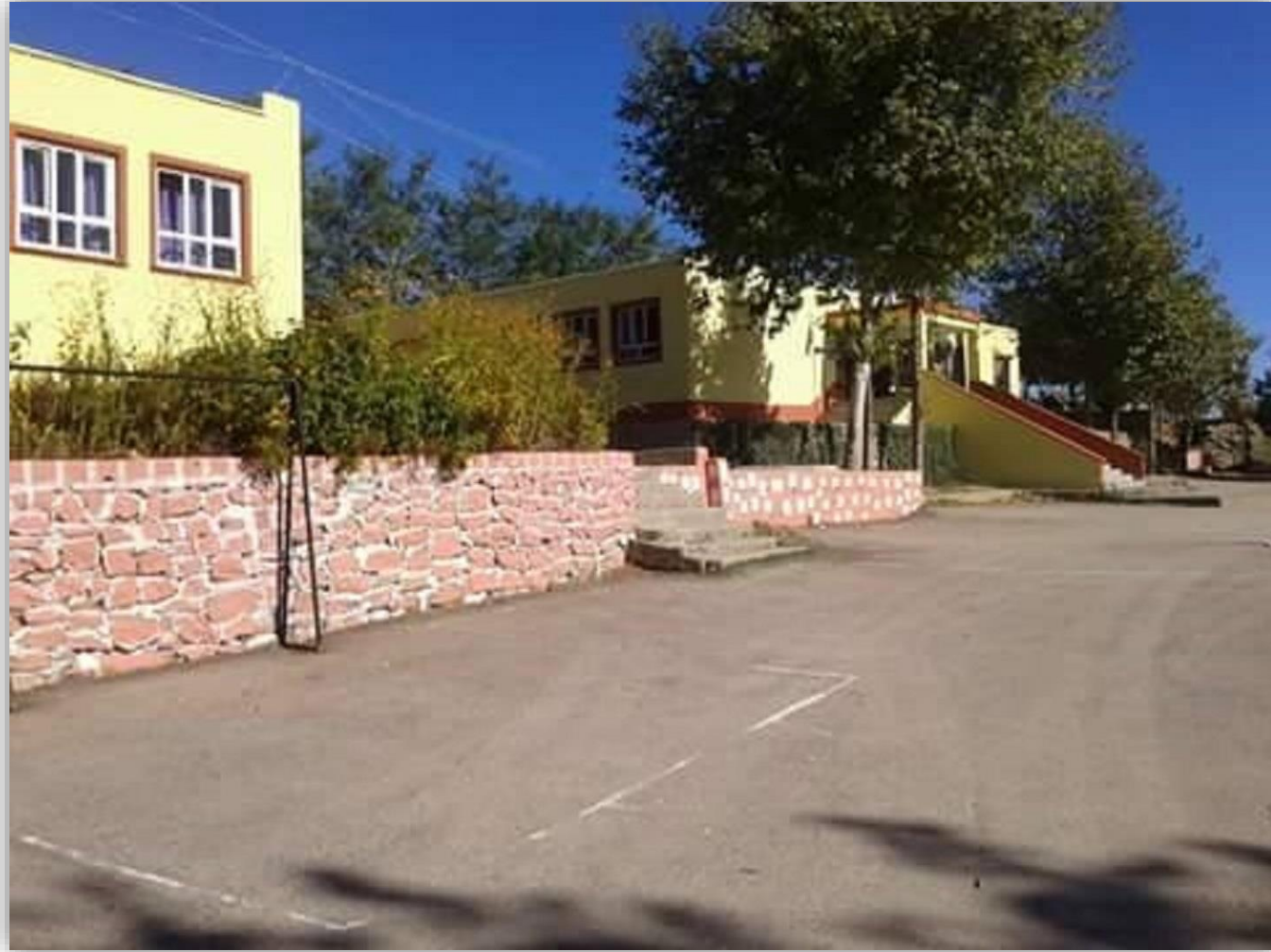
KOZAN AKDAM İLKOKULU/ORTAOKULU